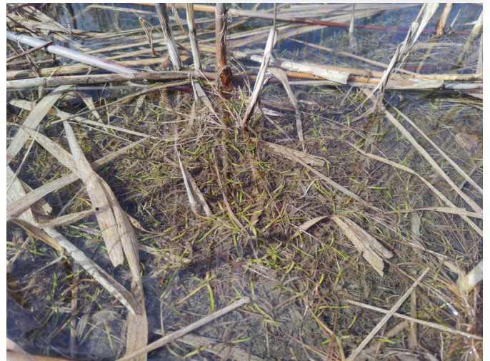
Strandling, Foto: B. Flint.