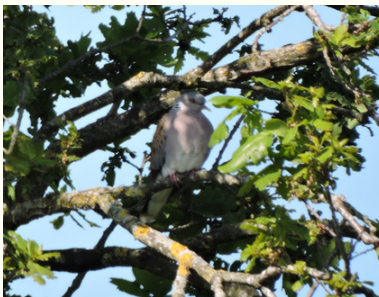
Sehr erfreulich waren die Nachweise von insgesamt 4 Brutpaaren der Turteltaube in der Gebietskulisse.

Das Team der ÖGE war dieses Jahr knapp 2000 Stunden in der Gebietskulisse unterwegs, hat kartiert, Pflegemaßnahmen begleitet und Vor-Ort Termine wahrgenommen. Einige tierische Highlights, die sich in diesem Jahr zugetragen haben, würden wir gerne mit Ihnen teilen: