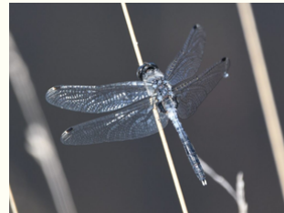
Die laut Rote Liste extrem seltene Östliche Moosjungfer konnte in den Moorschlatts und Heiden in Wachendorf dokumentiert werden.

Dieser adulte Seeadler konnte im April im Geestmoor fotografisch festgehalten werden.