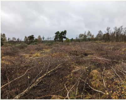
gerodete Gehölze auf der Teilfläche im Syen-Venn

Trotz wetterbedingter Verzögerungen konnten die letzten Pflegearbeiten für dieses Jahr doch noch erfolgreich abgeschlossen werden: Im Syen-Venn wurden zur Verbesserung des Zustands des Lebensraumtyps 7120 "Renaturierungsfähige degradierte Hochmoore" Gehölzentnahmen durchgeführt. Im Weiher am Syen-Venn wurde durch die Rodung von Gebüsch entlang von Parzellengrenzen eine Öffnung des Gebiets zur Förderung der Wiesenvogelbestände erreicht.