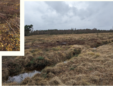
Teilfläche im Syen-Venn nach Räumung der gerodeten Gehölze