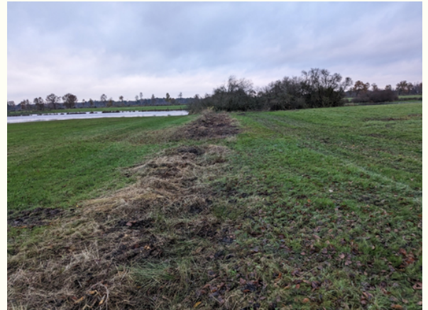
Parzellengrenze am Weiher im Syen-Venn nach Durchführung der Rodungsmaßnahmen mit sichtbarer Überstauung von Teilflächen im Gebiet